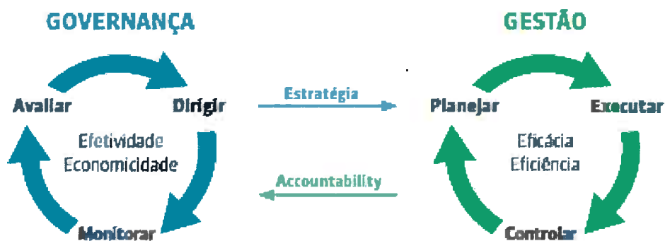
Figura 1 - Relação entre Governança e Gestão