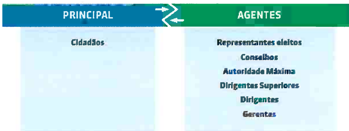
Figura 2 - Relação principal-agente no setor público

RELAÇÃO PRINCIPAL-AGENTES NO SETOR PÚBLICO